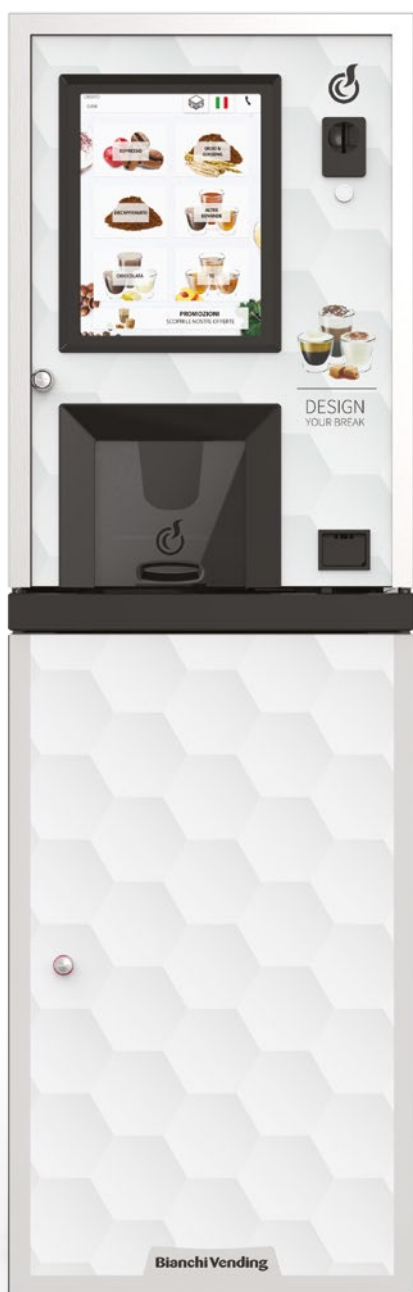
LEI250 TOUCH15" + MOBILETTO + KIT ADESIVO CON GRAFICA "DESIGN YOUR BREAK" IN OPZIONE

TOUCH SELECTIONS SMART SELECTIONS EASY SELECTIONS