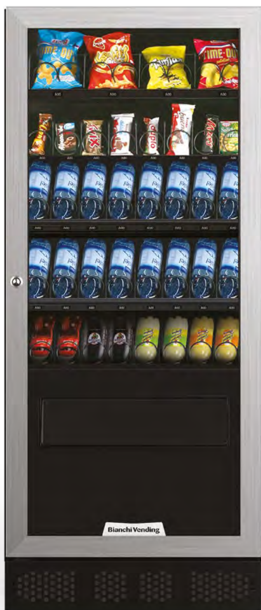
ARIA M SLAVE