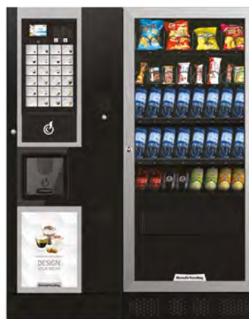
LEI400 SMART + ARIA M SLAVE

ARIA M, distributeur automatique réfrigéré à 3° pour la vente de produits snacks, sandwiches, produits frais, boîtes et bouteilles.